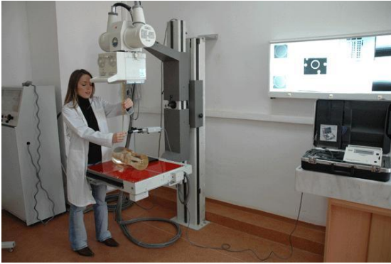
Alfa - Beta Sayım Laboratuvarı