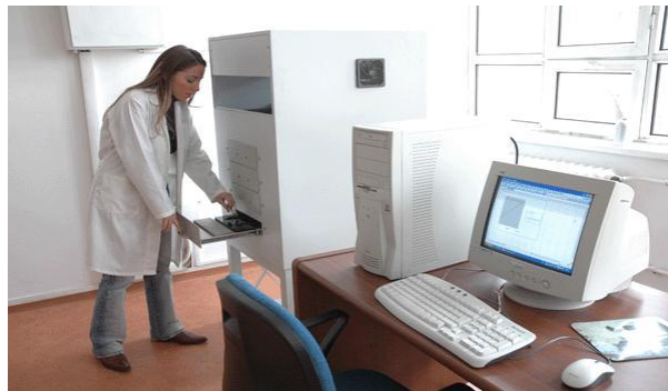
Nükleer Bilimler Enstitüsü Laboratuvarları