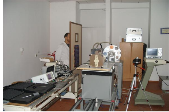
x-Işını Kalibrasyon Dedeksiyon ve Ölçüm Laboratuvarı