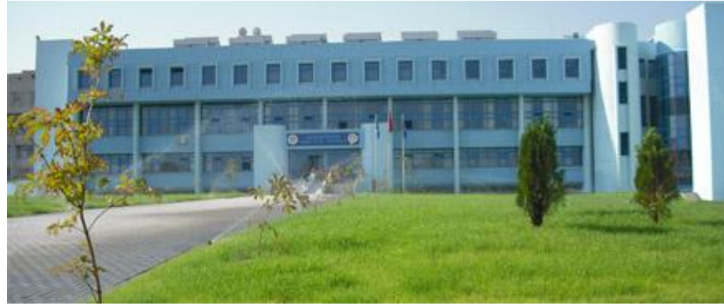
Yabancı Diller Yüksekokulundan bir görünüm