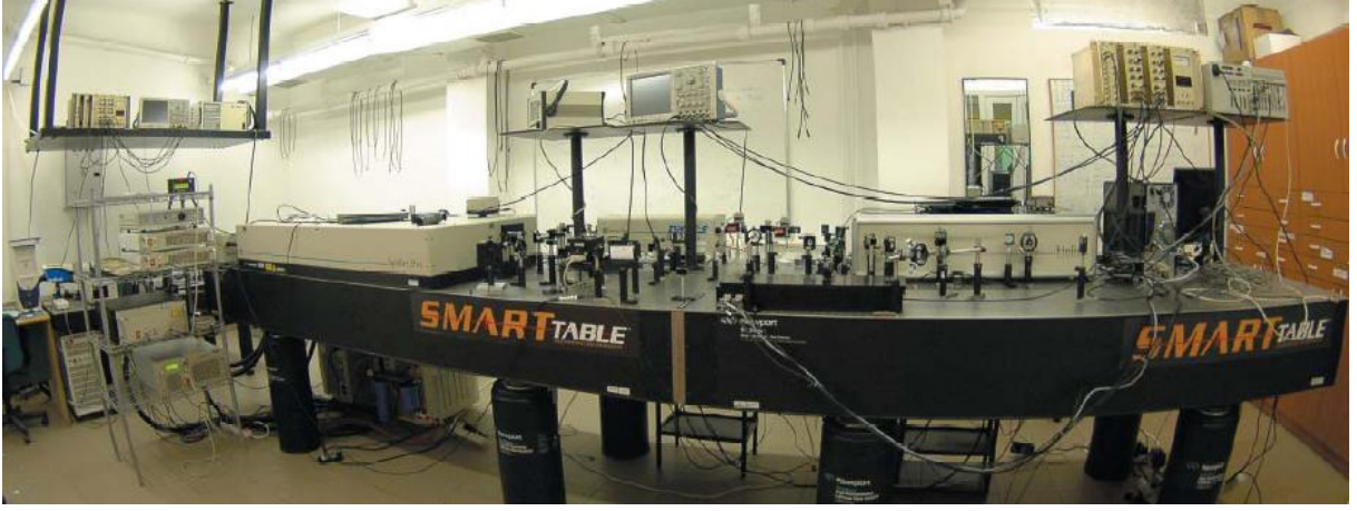
Optik Malzemeler Araştırma Laboratuvarından Bir Görünüm