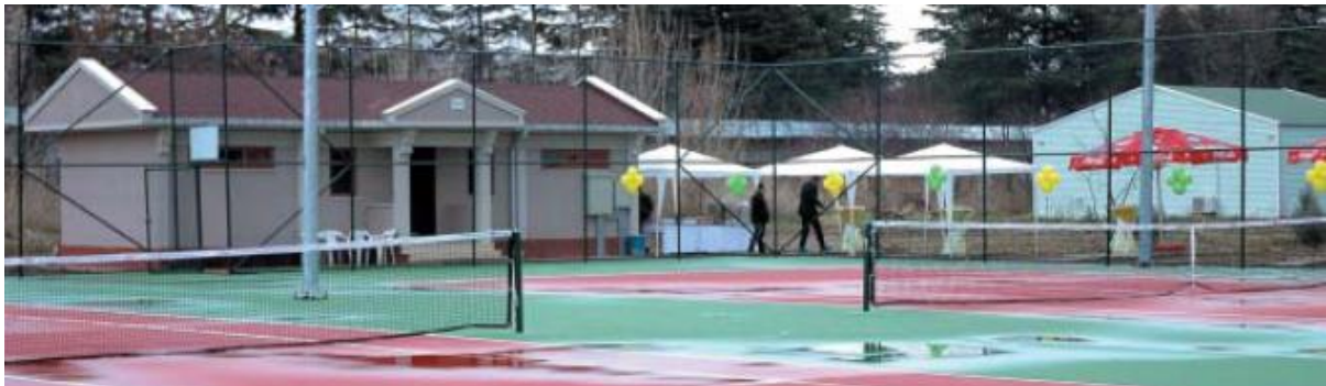
Ziraat Fakültesi Tenis Kortlarından Bir Görünüm