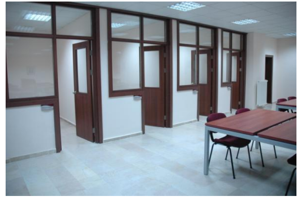
Tıp Fakültesi Prof.Dr.A.Olcay Tiryaki Öğrenme Merkezi