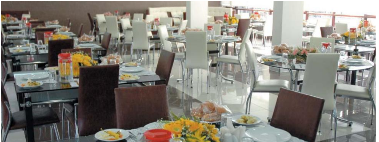
Yemekhanelerden Bir Görünüm