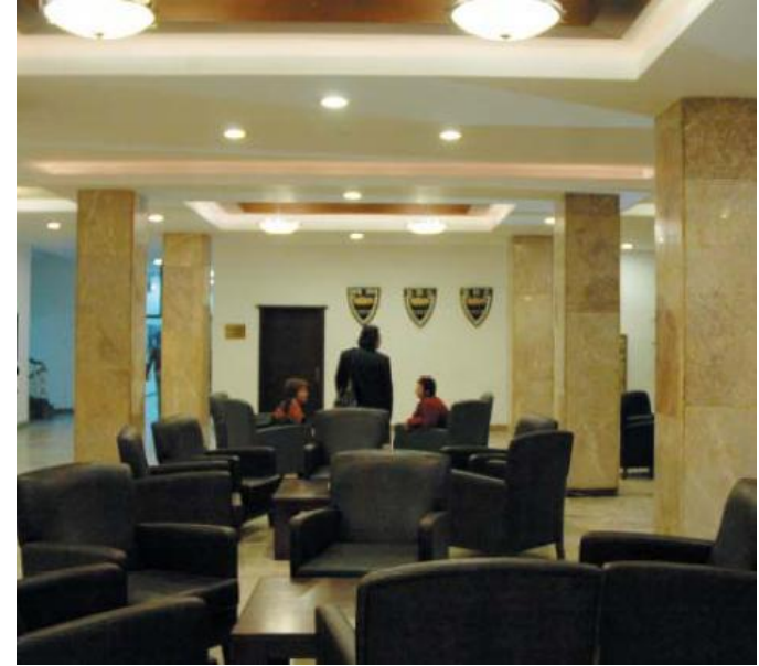
Siyasal Bilgiler Fakültesi Sütunlu Salondan Bir Görünüm