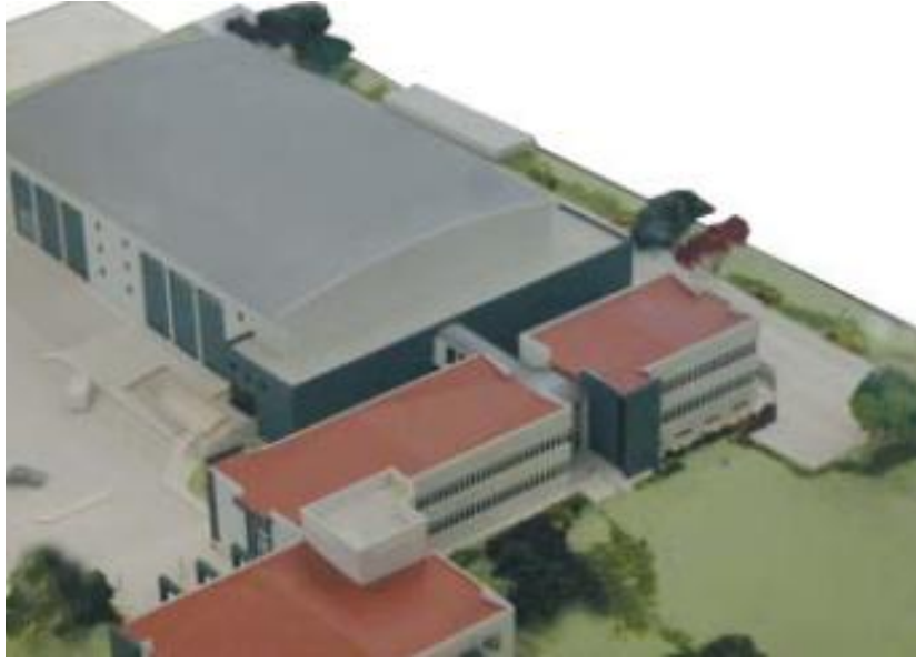
Türk Hızlandırıcı Merkezi Binası Proje Maketi