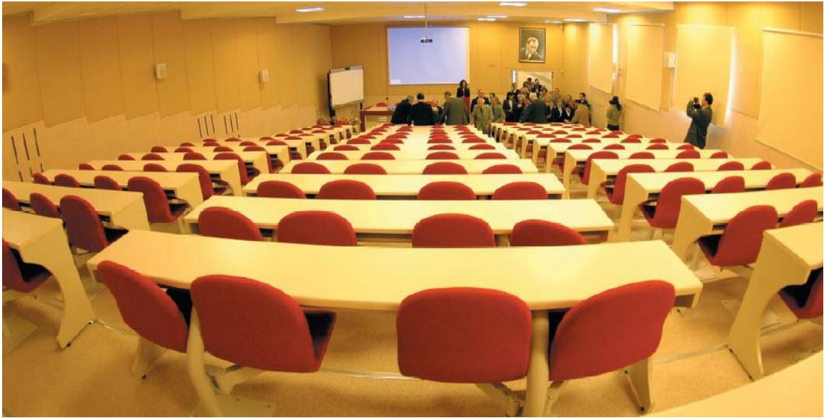
Ziraat Fakültesi Konferans Salonundan Bir Görünüm