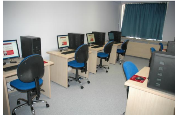
Ziraat Fakültesi Ali Numan Kırac Öğrenme Merkezi