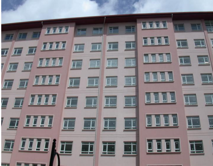
Türk Diyanet Vakfı Tarafından Hibe Olarak Yaptırılan İlahiyat Fakültesi Ek Hizmet Binasından Bir Görünüm