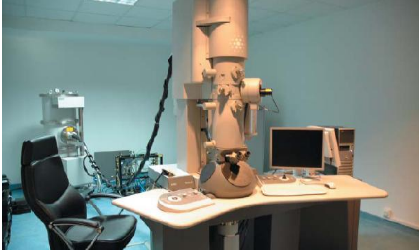
Elektron Mikroskop Laboratuvarından bir görünüm